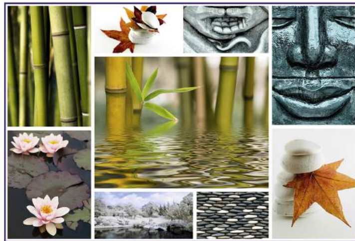
Can Stock Photo

I nostri BUONI OMAGGIO da 60, 90 o 120 min, renderanno il Vostro pensiero speciale e gradito! Venite a scoprire, in negozio o sul sito, le nostre numerose proposte per i Vostri regali.