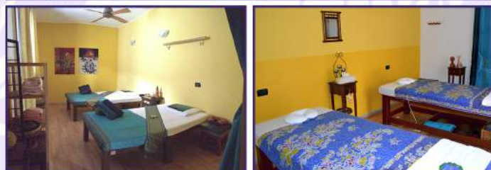
E.R.A. Nuad Thai